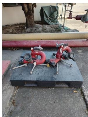
รูปที่ 9 อุปกรณ์ระงับเหตุฉุกเฉิน

รูปที่ 3-1 ภาพถ่ายประกอบการปฏิบัติตามมาตรการป้องกันและแก้ไข ผลกระทบสิ่งแวดล้อม โครงการท่อส่งน้ำมัน บริษัท กูเวต ปิโตรเลียม เอวี่เอช (ประเทศไทย) จำกัด