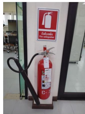
รูปที่ 9 อุปกรณ์ระงับเหตุฉุกเฉิน

รูปที่ 3-1 ภาพถ่ายประกอบการปฏิบัติตามมาตรการป้องกันและแก้ไข