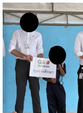
รูปที่ 5 ตัวอย่างกิจกรรมชุมชนสัมพันธ์

รูปที่ 3-1 ภาพถ่ายประกอบการปฏิบัติตามมาตรการป้องกันและแก้ไข ผลกระทบสิ่งแวดล้อม โครงการทอส่งน้ำมัน บริษัท กูเวต ปิโตรเลียม เอวิเอชั่น (ประเทศไทย) จำกัด