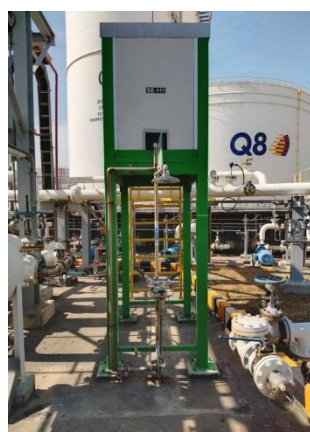
รูปที่ 9 อุปกรณ์ระงับเหตุฉุกเฉิน (ต่อ)

รูปที่ 3-1 ภาพถ่ายประกอบการปฏิบัติตามมาตรการป้องกันและแก้ไข ผลกระทบสิ่งแวดล้อม โครงการท่อดำเนิน บริษัท กูเวต ปิโตรเลียม เอวีเอช (ประเทศไทย) จำกัด