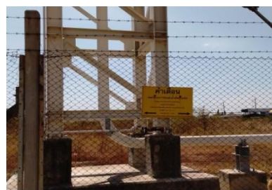
รูปที่ 13 ป้ายเตือนแสดงตำแหน่งท่ส่งน้ำมัน

รูปที่ 3-1 ภาพถ่ายประกอบการปฏิบัติตามมาตรการป้องกันและแก้ไข ผลกระทบสิ่งแวดล้อม โครงการท่ส่งน้ำมัน บริษัท กูเวต ปิโตรเลียม เอวี่เอช (ประเทศไทย) จำกัด