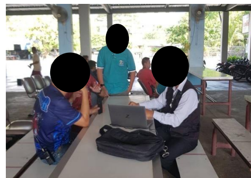
รูปที่ 7 การแจ้งชุมชนเกี่ยวกับการซ้อมแผนฉุกเฉิน

รูปที่ 3-1 ภาพถ่ายประกอบการปฏิบัติตามมาตรการป้องกันและแก้ไข ผลกระทบสิ่งแวดล้อม โครงการทอส่งน้ำมัน บริษัท คูเวต ปิโตรเลียม เอวีเอชั่น (ประเทศไทย) จำกัด