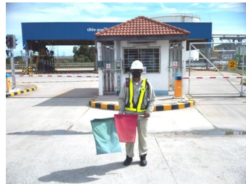
รูปที่ 2 เจ้าหน้าที่บริเวณหน้าประตูทางเข้า-ออก