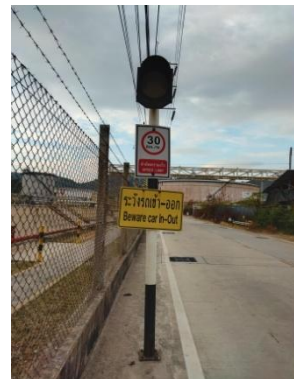
รูปที่ 4 ป้ายจำกัดความเร็ว

รูปที่ 3-1 ภาพถ่ายประกอบการปฏิบัติตามมาตรการป้องกันและแก้ไข ผลกระทบสิ่งแวดล้อม โครงการท่อส่งน้ำมัน บริษัท กูเวต ปิโตรเลียม เอวี่เอช (ประเทศไทย) จำกัด