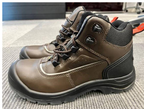
รูปที่ 11 อุปกรณ์คุ้มครองความปลอดภัยส่วนบุคคล (PPE)