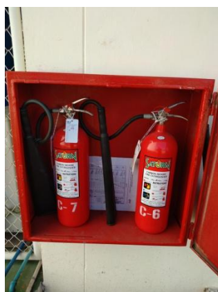
รูปที่ 9 อุปกรณ์ระงับเหตุฉุกเฉิน (ต่อ)

รูปที่ 3-1 ภาพถ่ายประกอบการปฏิบัติตามมาตรการป้องกันและแก้ไข ผลกระทบสิ่งแวดล้อม โครงการท่อดส่งน้ำมัน บริษัท กูเวต ปิโตรเลียม เอวี่เอช (ประเทศไทย) จำกัด