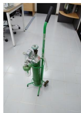
รูปที่ 12 ห้องพยาบาลและอุปกรณ์ปฐมพยาบาล

รูปที่ 3-1 ภาพถ่ายประกอบการปฏิบัติตามมาตรการป้องกันและแก้ไข ผลกระทบสิ่งแวดล้อม โครงการท่อส่งน้ำมัน บริษัท คูเวต ปิโตรเลียม เอวีเอช (ประเทศไทย) จำกัด