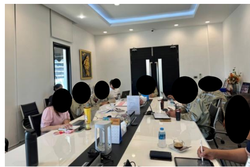
รูปที่ 6 การซ้อมแผนฉุกเฉิน