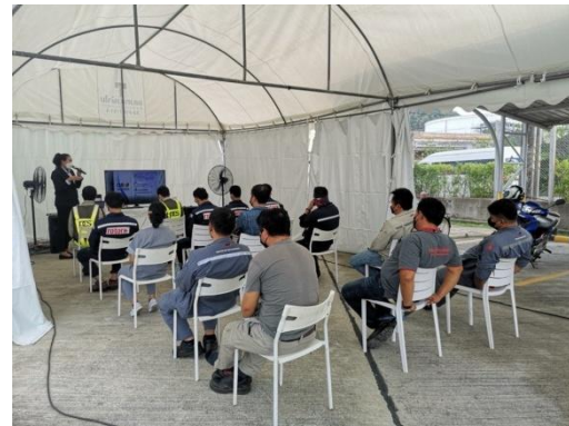
รูปที่ 3 การอบรมพนักงานขับรถ