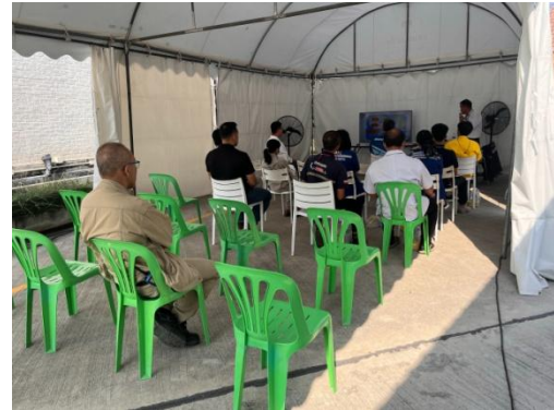
รูปที่ 8 การฝึกอบรมผู้นำชุมชนและหน่วยงานราชการในพื้นที่ตามแผนฉุกเฉิน