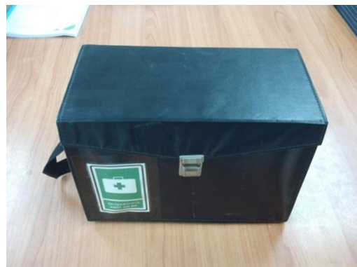
รูปที่ 12 ห้องพยาบาลและอุปกรณ์ปฐมพยาบาล (ต่อ)